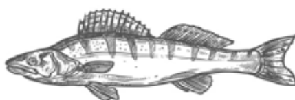
Sandacz Europa środkowo wschodnia