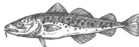
Dorsz - Portugalia