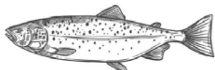
Łosoś - Norwegia

Grillowana patelnia ryb - dorsz, sandacz, łosoś, krewetki, 190,- (frytki scoops, sos z szyjek rakowych i pora, sałatka ze świeżych warzyw) Gegrillte Fischpfanne (Dorsch, Zander, Lachs, Garnelen, Scoops Pommes, Flusskrebs- und Lauch- soße, Salat aus frischem Gemüse) Grilled Fish Pan (cod, pike-perch, salmon, prawns, scoops fries, crayfish and leek sauce, fresh vege- table salad)